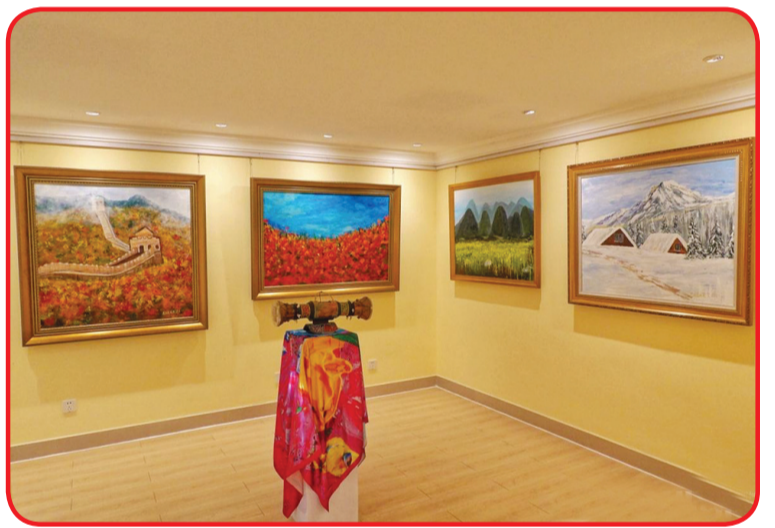
Salah satu lukisan yang ditampilkan dalam pameran tersebut.