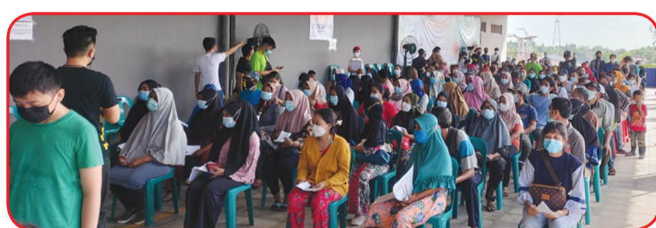
Warga sedang menunggu giliran screening.