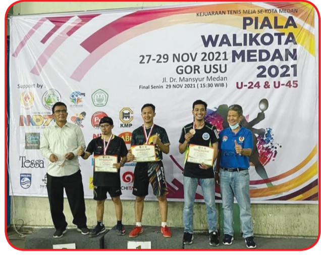
Kapten tim berfoto bersama pelatih dan juara satu, dua dan tiga.

MEDAN (IM) - Kejuaraan Tenis Meja Piala Wali Kota Medan 2021 yang diselenggarakan 27-29 November di GOR USU Jalan Dr. Mansyur Medan, berlangsung sukses. Kejuaraan dibagi dalam dua kelompok putra dan putri serta kelompok usia 24 tahun dan 45 tahun. Total 11 tim tenis meja dan 80 orang pemain ikut serta dalam kejuaraan tersebut. Termasuk Tim Tenis Meja Persahabatan Medan dan Tim Tenis Meja Yasora Medan.