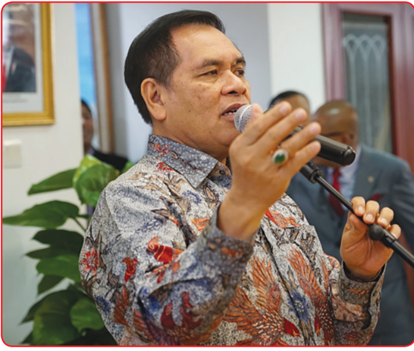
Duta Besar Djauhari Oratmangun.

BEIJING (IM) - Dubes RI untuk Tiongkok Djauhari Oratmangun dan istri Wiwik Oratmangun, Rabu (1/12) lalu menyelenggarakan jamuan makan