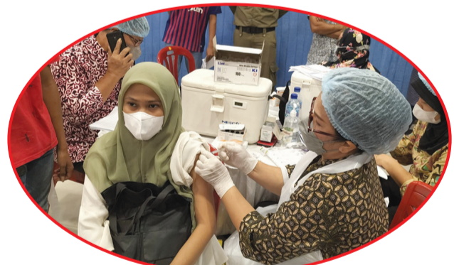
Salah seorang warga sedang divaksin.

MEDAN (IM) - Rotary Club Medan Deli bersama dengan Walubi (Perwakilan Umat Buddha Indonesia) Sumatera Utara, Sabtu (13/11) lalu menyelenggarakan vaksinasi gratis sebanyak 3.000 dosis, di lantai dua Suzuya Marelan Mall Kecamatan Marelan.