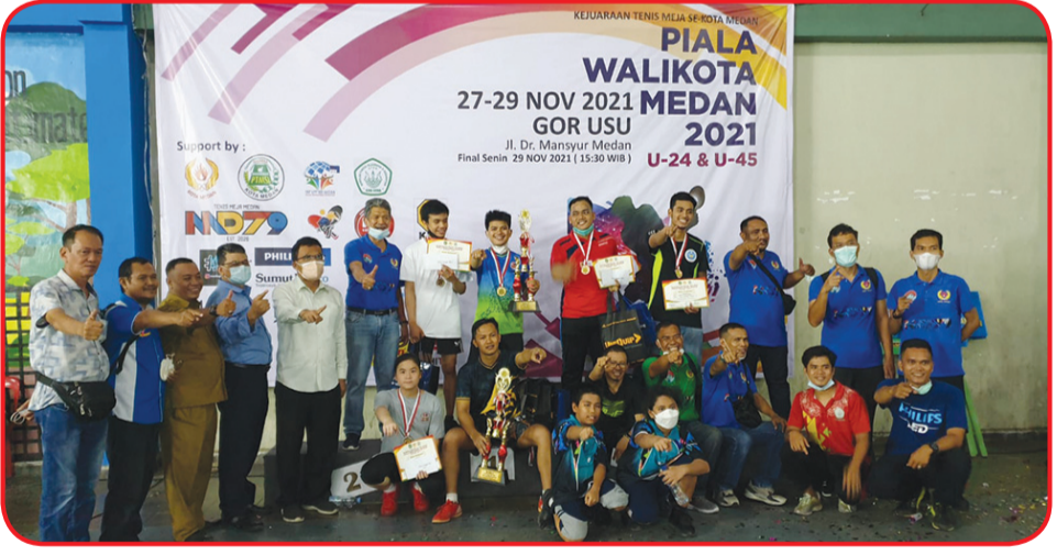
Pengurus dan pimpinan Tim Persahabatan berfoto bersama seluruh juara.