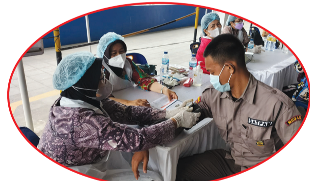
Salah seorang anggota Polri sedang diperiksa tekanan darahnya.